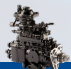
SISTEMA DE INJEÇÃO