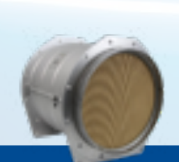
SISTEMA DE ESCAPE