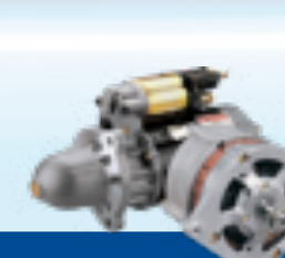
SISTEMA ELÉTRICO ROTATIVO