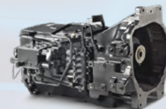
SISTEMAS DE TRANSMISSÃO E COMPONENTES DE TRANSMISSÃO